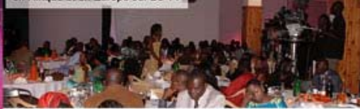
Le Festival Music Ebène lutte contre le paludisme en distribuant des moustiquaires imprégnées aux populations défavorisées. Cette année encore plus de 10 000 vies vont être sauvées.