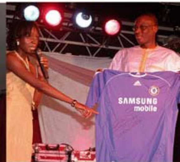
Un maillot dédié de Didier Drogba a été vendu aux enchères